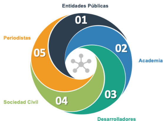
Ilustración 1. Ecosistema de actores de datos abiertos