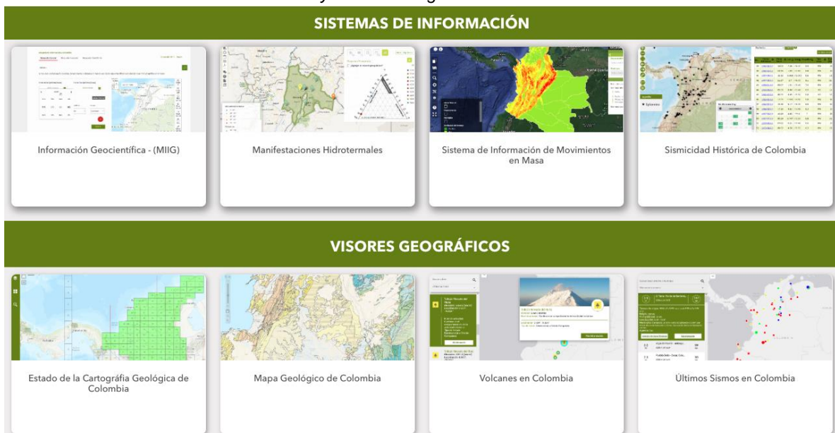
Ilustración 7. Sistemas de información y Visores Geográficos indexados - Portal de datos abiertos - SGC