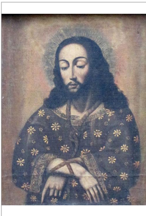
Imágen: Vista anterior