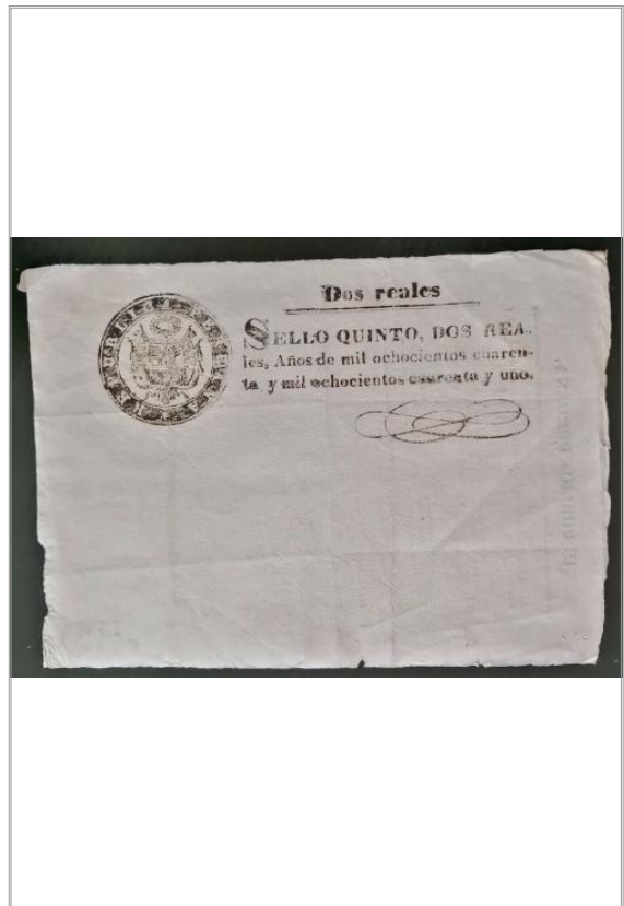
Imágen: Vista Posterior