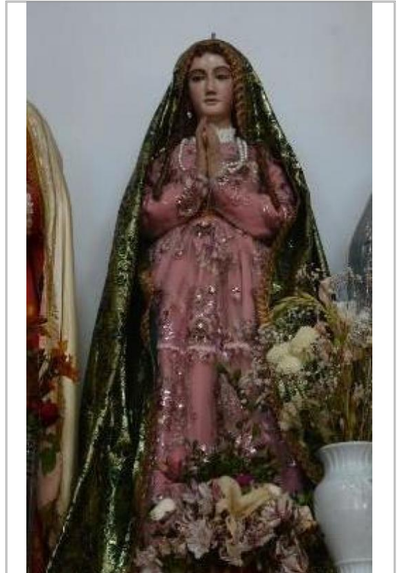
Imágen: Vista sin corona después de robo