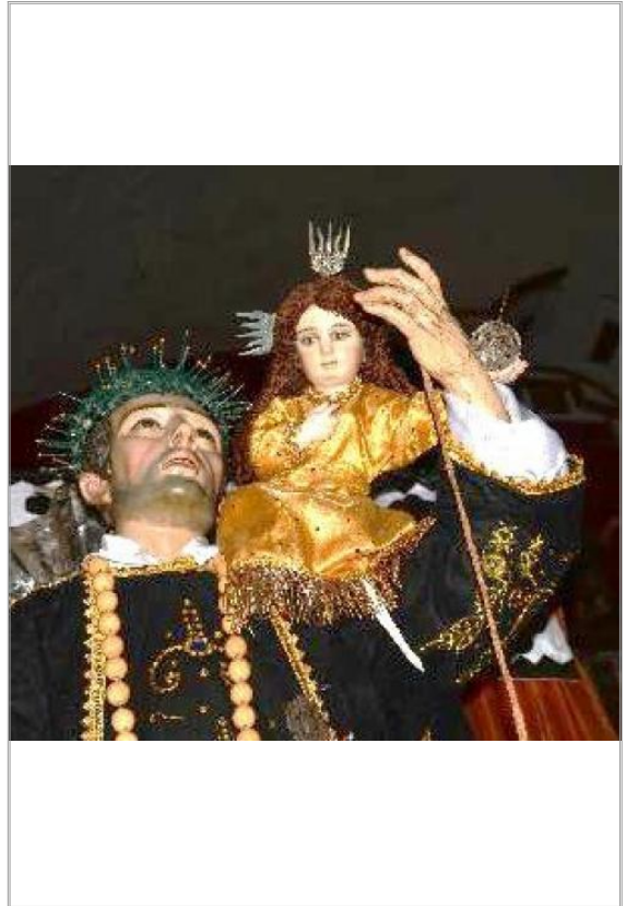
Imágen: Detalle de escultura después de robo