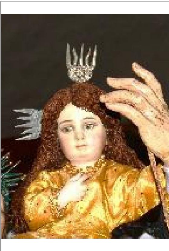
Imágen: Cabeza de Niño después de robo