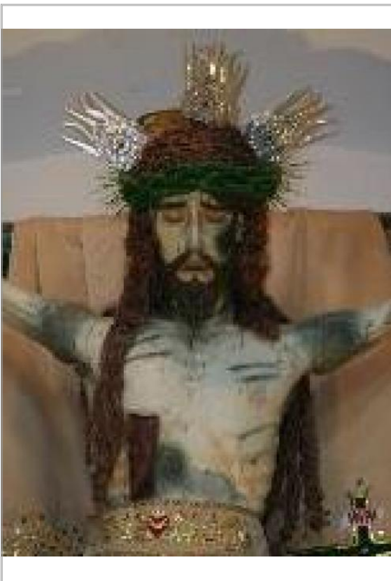
Imágen: "Cristo crucificado" antes de robo