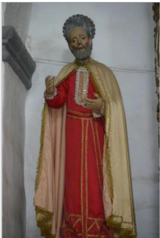
Imágen: Vista de aureola antes de robo (2009)