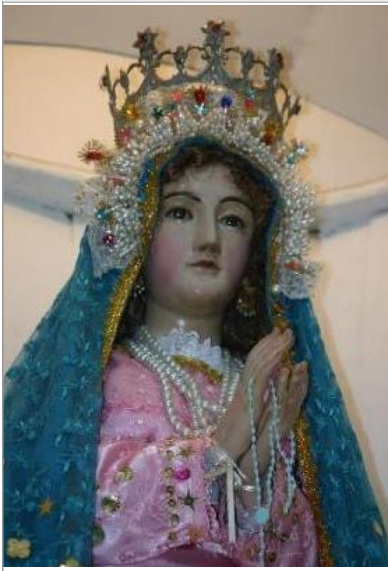
Imágen: Detalle con corona antes de robo