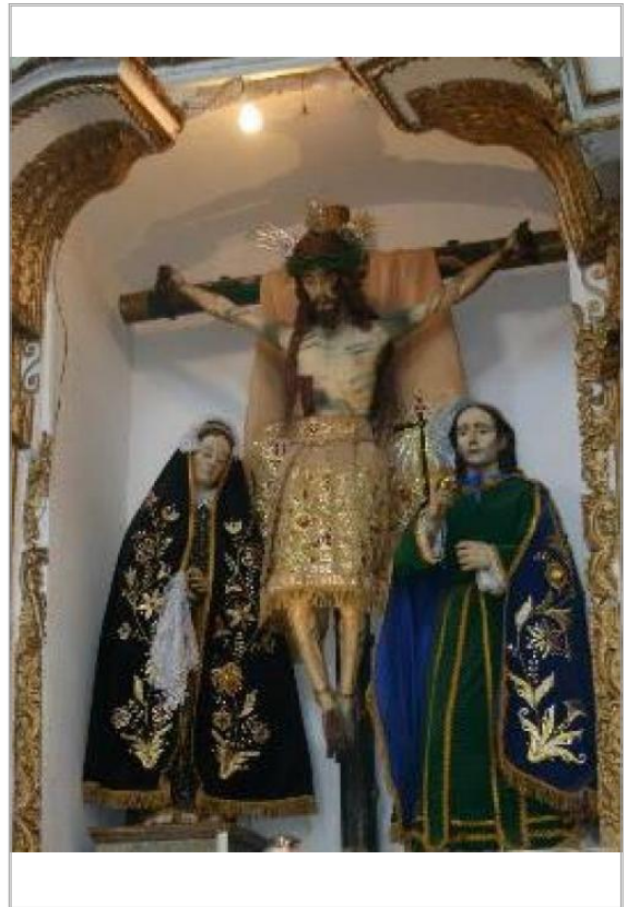
Imágen: "Calvario" (2009)