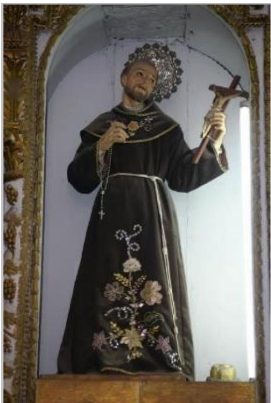
Imágen: Vista de aureola antes de robo (2009)