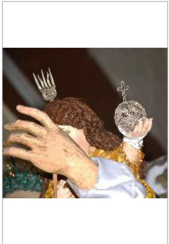
Imágen: Detalle de potencia faltante