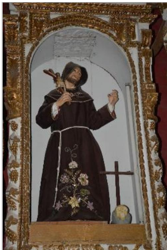
Imágen: Escultura sin aureola después de robo