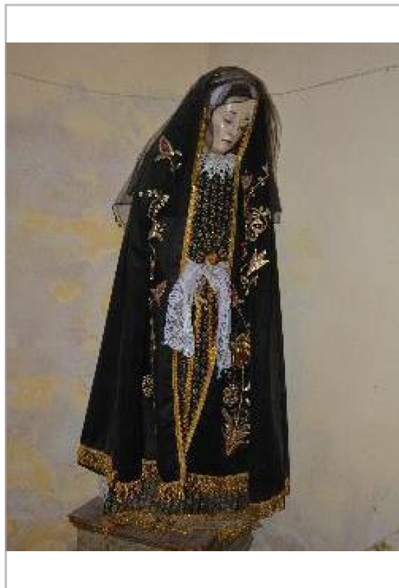
Imágen: "Virgen Dolorosa" después de robo