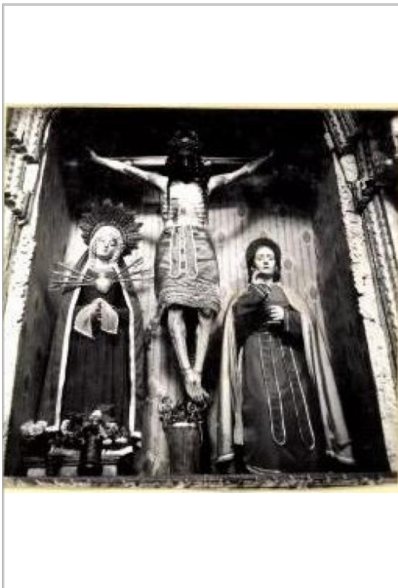
Imágen: "Calvario" antes de robo (1976)