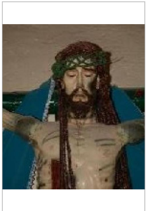
Imágen: "Cristo crucificado" después de robo