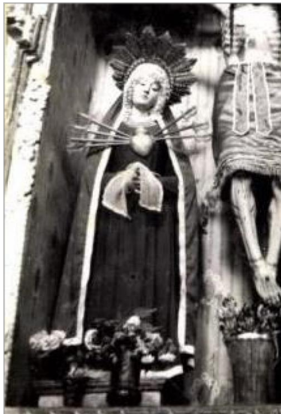
Imágen: "Virgen Dolorosa" antes de robo