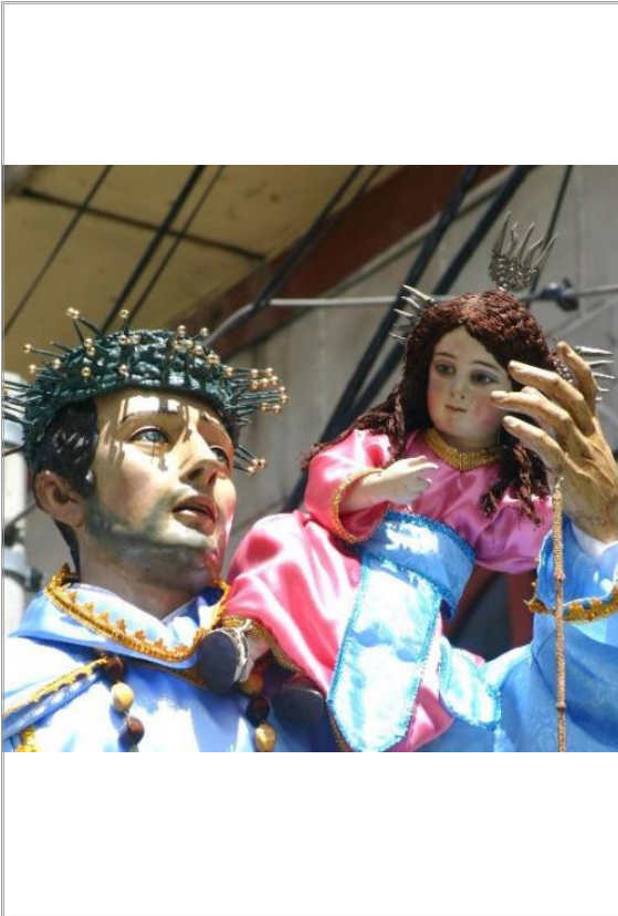
Imágen: Detalle de "San Juan de Dios" (2009)