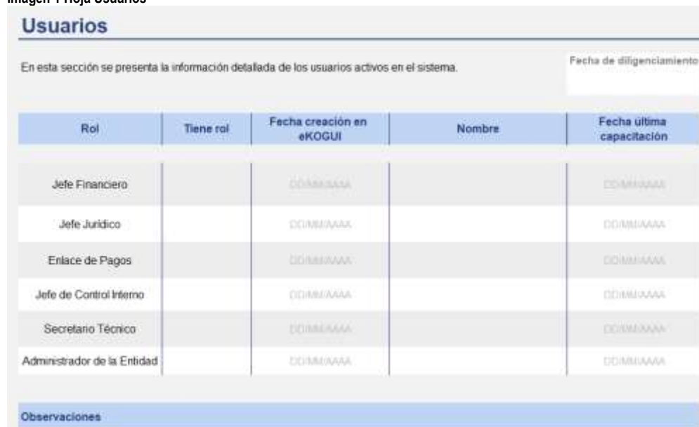
Imagen 1 Hoja Usuarios