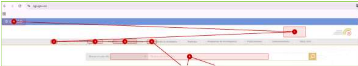
Imagen 1 - Tabulación NO ordenada

Nota. En la validación del ítem (1.1.1.F) se encontró tabulación no ordenada, así: