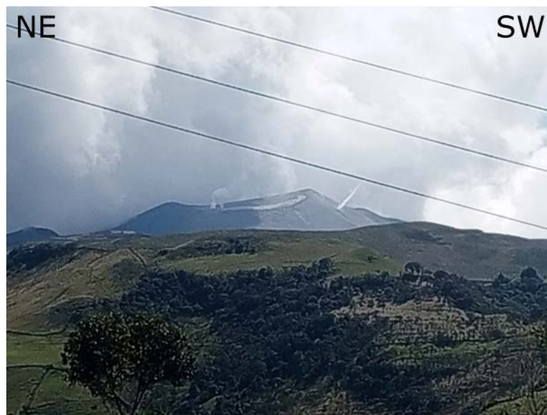
Figura 1. Fotografía del volcán Puracé captada por un habitante de la vereda Alto Anambó (al noroccidente del volcán Puracé) en el municipio de Puracé.

Mientras se mantiene el estado de alerta Naranja, es posible que se presenten fluctuaciones temporales en los niveles de actividad del volcán, es decir, que en algunos momentos puede disminuir con respecto a días o semanas anteriores. Sin embargo, esto no implica necesariamente que el volcán haya retornado a un nivel de actividad estable. Para regresar a un nivel más estable (estado de alerta Amarilla), se requiere un tiempo prudencial en el que se evalúan todos los parámetros monitoreados y se determinan tendencias que puedan indicar una estabilidad confiable.