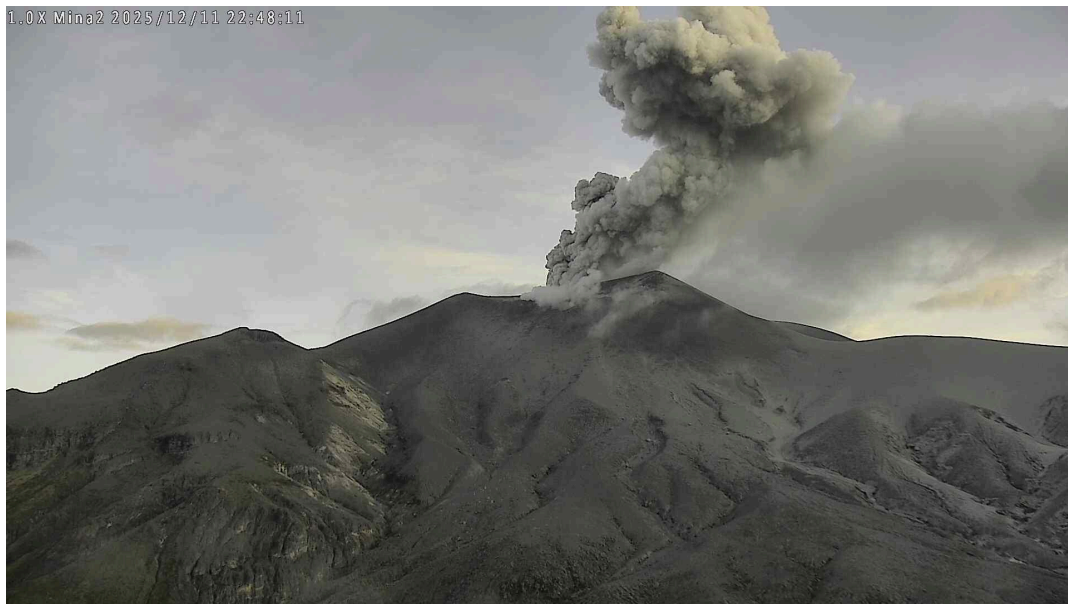
Figura 1. Registro de la cámara Mina2, ubicada a 2,2 km en dirección norte del volcán Puracé. Columna de gases registrada a las 5:48 p. m. del 11 de diciembre de 2025, con una altura de hasta 700 m sobre la cima del volcán Puracé.

Mientras se mantiene el estado de alerta Naranja, es posible que se presenten fluctuaciones temporales en los niveles de actividad del volcán, es decir, que en algunos momentos puede disminuir con respecto a días o semanas anteriores. Sin embargo, esto no implica necesariamente que el volcán haya retornado a un nivel de actividad estable. Para regresar a un nivel más estable (estado de alerta Amarilla), se requiere un tiempo prudencial en el que se evalúan todos los parámetros monitoreados y se determinan tendencias que puedan indicar una estabilidad confiable.