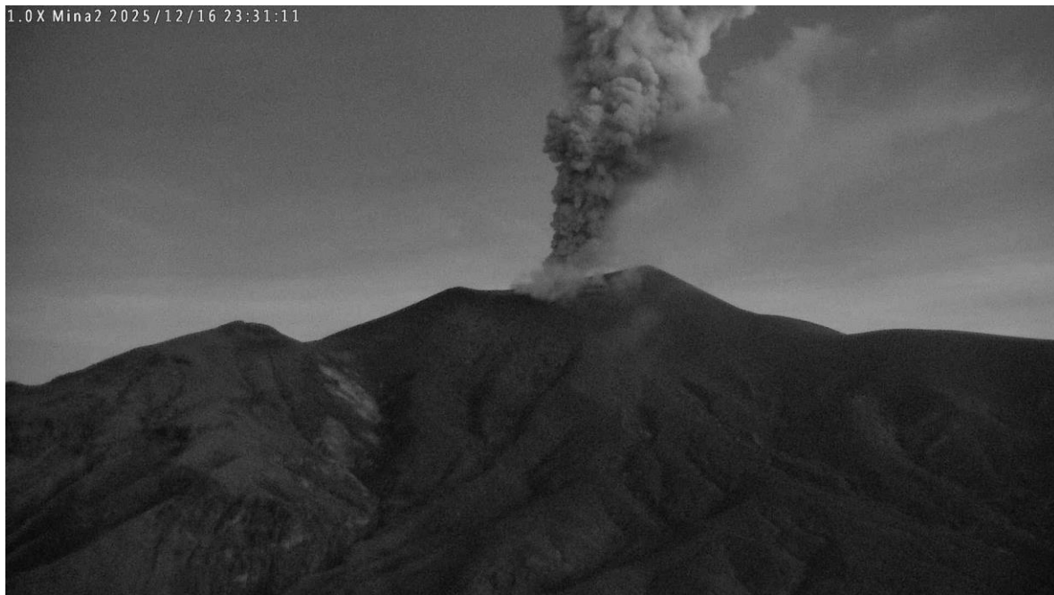
Figura 1. Registro de la cámara Mina, ubicada a 2,2 km en dirección norte del volcán Puracé. Columna de gases y ceniza registrada a las 6:31 p. m. del 16 de diciembre de 2025

Mientras se mantiene el estado de alerta Naranja, es posible que se presenten fluctuaciones temporales en los niveles de actividad del volcán, es decir, que en algunos momentos puede disminuir con respecto a días o semanas anteriores. Sin embargo, esto no necesariamente implica que el volcán haya retornado a un nivel de actividad estable. Para regresar al estado de alerta Amarilla (mayor estabilidad), se requiere un tiempo prudencial en el que se evalúen todos los parámetros monitoreados y se determinen tendencias que así lo indiquen.