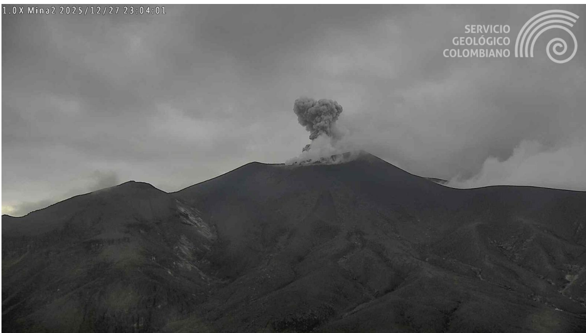
Figura 1. Registro de la cámara Mina2 ubicada a 2,2 km en dirección norte del volcán Puracé. Esta emisión de gases y ceniza fue registrada a las 6:01 p. m. (hora local) del 27 de diciembre de 2025.

Mientras se mantiene el estado de alerta Naranja, es posible que se presenten fluctuaciones temporales en los niveles de actividad del volcán, es decir, que en algunos momentos puede disminuir con respecto a días o semanas anteriores. Sin embargo, esto no necesariamente implica que el volcán haya retornado a un nivel de actividad estable. Para regresar al estado de alerta Amarilla (mayor estabilidad), se requiere un tiempo prudencial en el que se evalúen todos los parámetros monitoreados y se determinen tendencias que así lo indiquen.