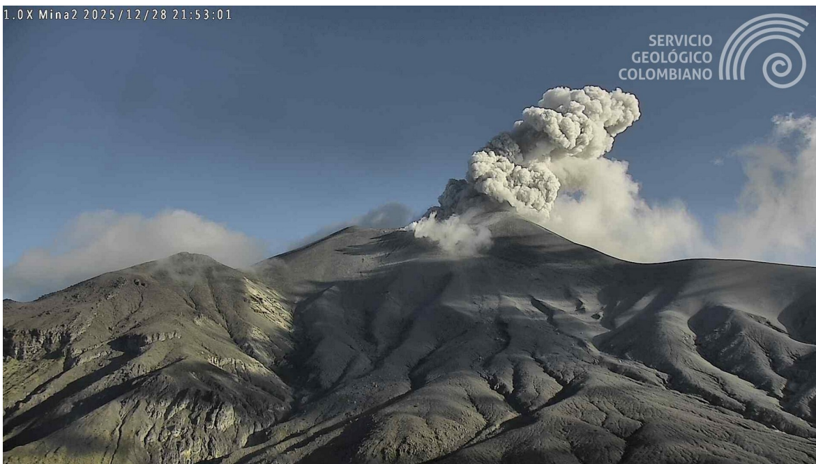
Figura 1. Registro de la cámara Mina2, ubicada a 2,2 km en dirección norte del volcán Puracé que muestra una emisión de gases y ceniza registrada a las 4:53 p. m. (hora local) del 28 de diciembre de 2025.

disminuir con respecto a días o semanas anteriores. Sin embargo, esto no necesariamente implica que el volcán haya retornado a un nivel de actividad estable. Para regresar al estado de alerta Amarilla (mayor estabilidad), se requiere un tiempo prudencial en el que se evalúen todos los parámetros monitoreados y se determinen tendencias que así lo indiquen.