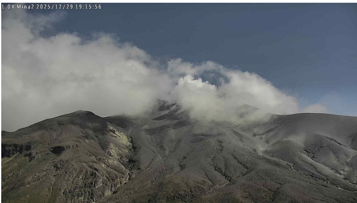
Figura 1. Registro de la cámara Mina2, ubicada a 2,2 km en dirección norte del volcán Puracé que muestra una emisión de gases registrada a las 2:15 p. m. (hora local) del 29 de diciembre de 2025.

Mientras se mantiene el estado de alerta Naranja, es posible que se presenten fluctuaciones temporales en los niveles de actividad del volcán, es decir, que en algunos momentos puede disminuir con respecto a días o semanas anteriores. Sin embargo, esto no necesariamente implica que el volcán haya retornado a un nivel de actividad estable. Para regresar al estado de alerta Amarilla (mayor estabilidad), se requiere un tiempo prudencial en el que se evalúen todos los parámetros monitoreados y se determinen tendencias que así lo indiquen.