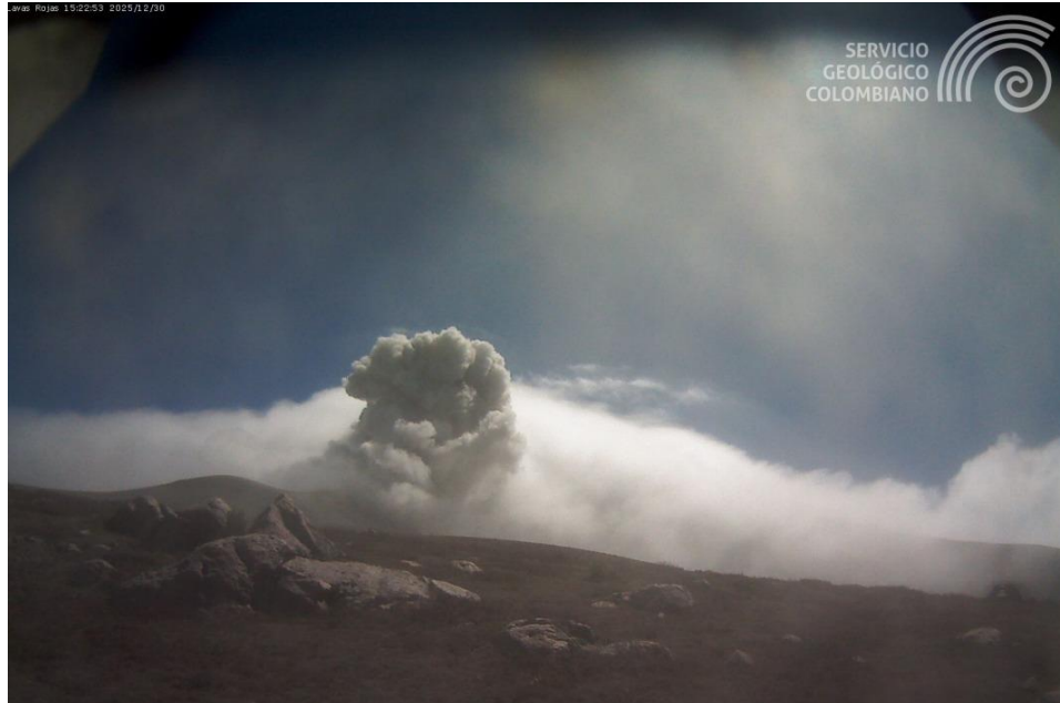
Figura 1. Registro de la cámara Lavas Rojas, ubicada a 2,4 km en dirección occidente del volcán Puracé que muestra una emisión de ceniza registrada a las 10:20 a. m. (hora local) del 30 de diciembre de 2025.

Con base en lo anteriormente expuesto, desde el SGC recomendamos no acercarse al cráter del volcán Puracé ni a sus alrededores, y seguir atentamente la evolución del proceso actual por medio de los boletines extraordinarios y la información publicada en nuestros canales oficiales, así como las instrucciones de las autoridades locales y departamentales, y de la Unidad Nacional para la Gestión del Riesgo de Desastres (UNGRD).