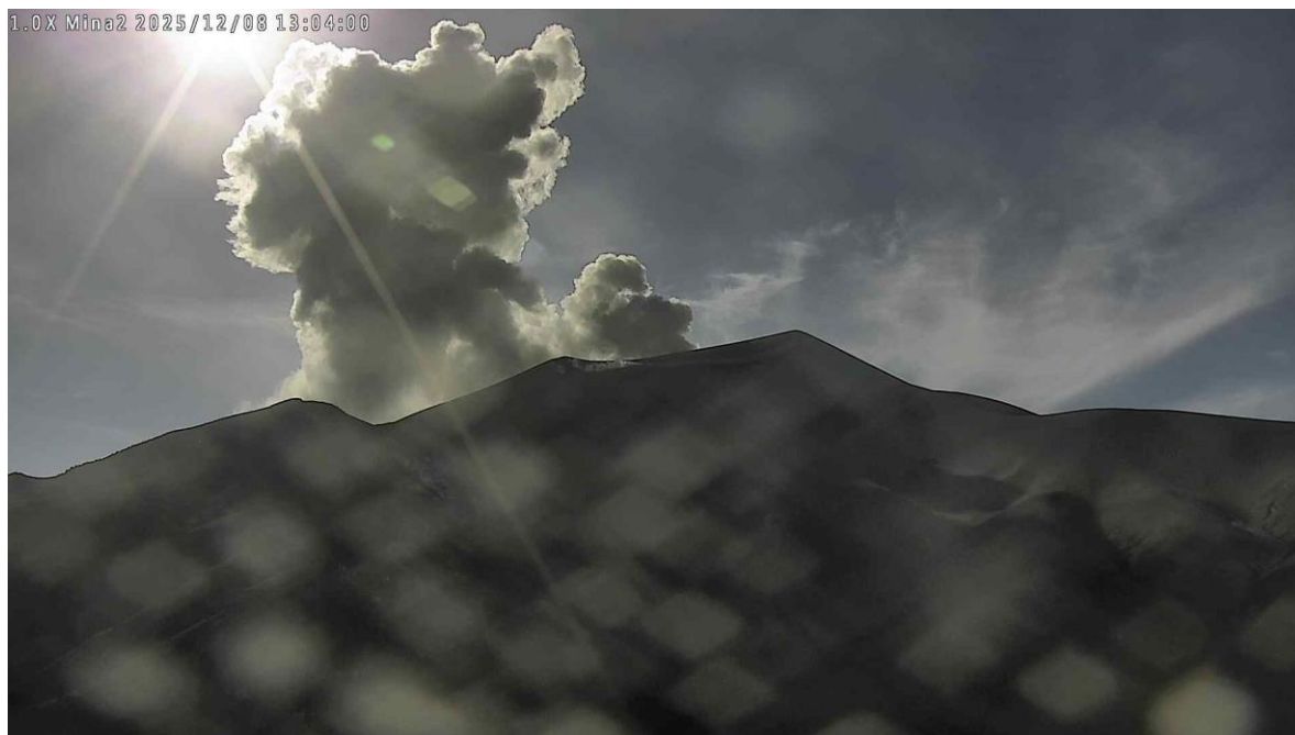
Figura 1. Registro de la cámara Mina, ubicada a 2,2 km en dirección norte del volcán Puracé. Columna de gases y ceniza registrada a las 8:00 a. m. del 8 de diciembre de 2025, que alcanzó una altura de 700 metros sobre la cima del volcán Puracé

disminuir con respecto a días o semanas anteriores. Sin embargo, esto no implica necesariamente que el volcán haya retornado a un nivel de actividad estable. Para regresar a un nivel más estable (estado de alerta Amarilla), se requiere un tiempo prudencial en el que se evalúan todos los parámetros monitoreados y se determinan tendencias que puedan indicar una estabilidad confiable.