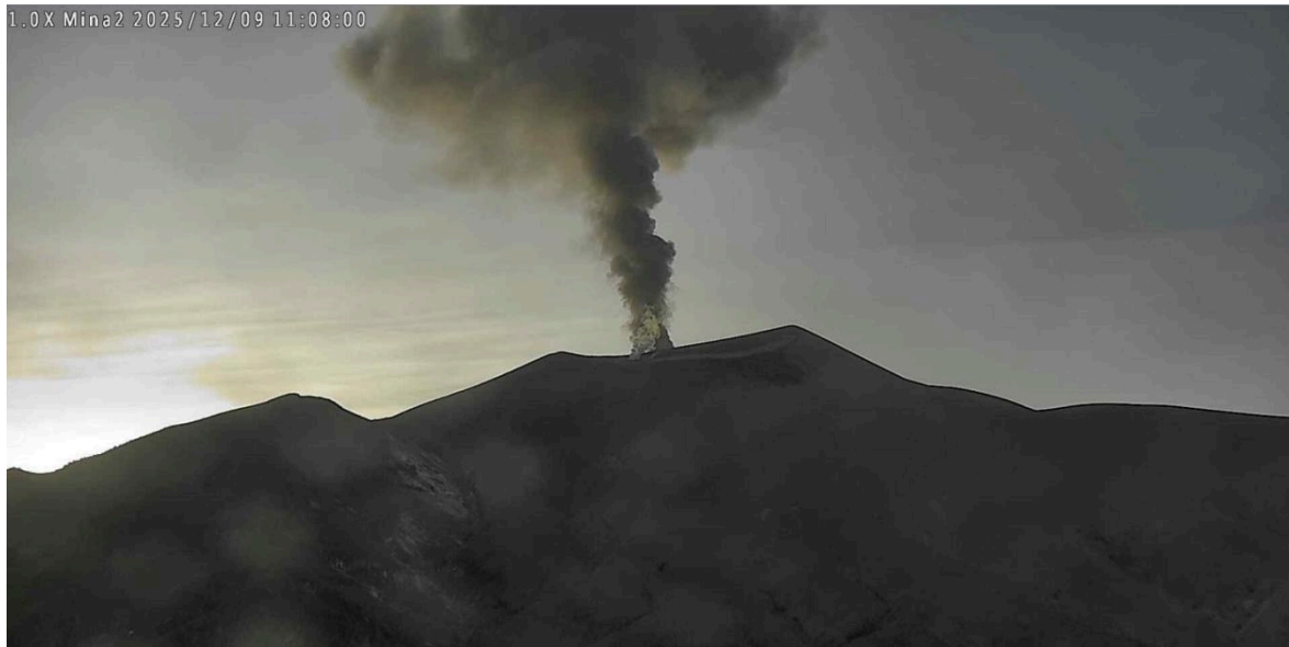
Figura 1. Registro de la cámara Mina, ubicada a 2,2 km en dirección norte del volcán Puracé. Columna de gases y ceniza registrada a las 6:01 a. m. del 9 de diciembre de 2025, que alcanzó una altura de 1000 metros sobre la cima del volcán Puracé

Mientras se mantiene el estado de alerta Naranja, es posible que se presenten fluctuaciones temporales en los niveles de actividad del volcán, es decir, que en algunos momentos puede disminuir con respecto a días o semanas anteriores. Sin embargo, esto no implica necesariamente que el volcán haya retornado a un nivel de actividad estable. Para regresar a un nivel más estable (estado de alerta Amarilla), se requiere un tiempo prudencial en el que se evalúan todos los parámetros monitoreados y se determinan tendencias que puedan indicar una estabilidad confiable.