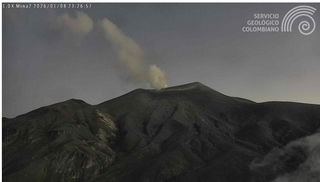
Figura 1. Registro de la cámara Mina, ubicada 2,2 km al norte del volcán Puracé del 8 de enero de 2026 a las 6:26 p. m. (hora local)

Con base en lo anteriormente expuesto, desde el SGC recomendamos no acercarse a los cráteres de los volcanes Puracé, Piccollo y Curiquinga, así como a sus alrededores. Sugerimos seguir atentamente la evolución del proceso actual por medio de los boletines extraordinarios y la información publicada en nuestros canales oficiales, así como las instrucciones de las autoridades locales y departamentales, y de la Unidad Nacional para la Gestión del Riesgo de Desastres (UNGRD).