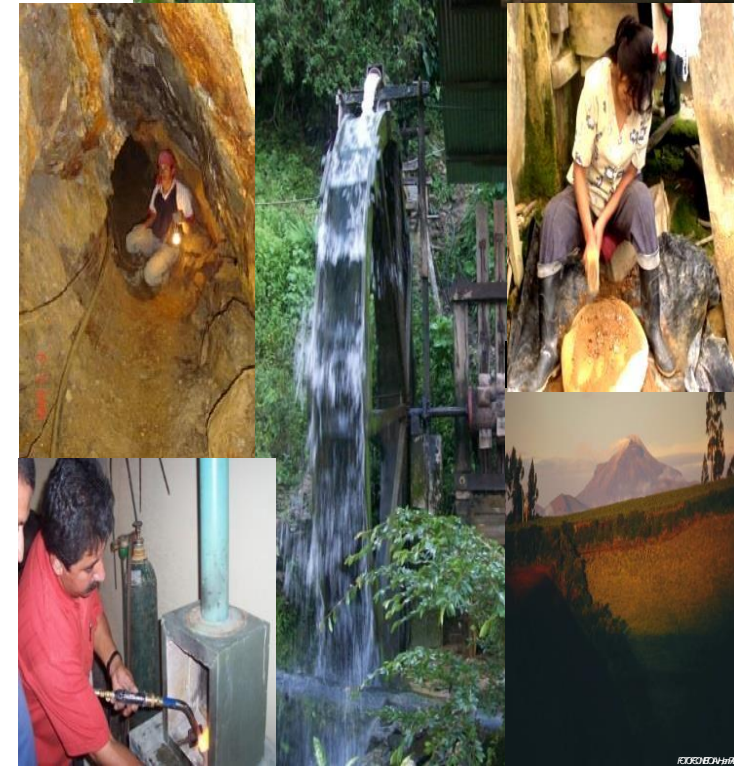
Patrimonio Geológico y Patrimonio Minero de Nariño