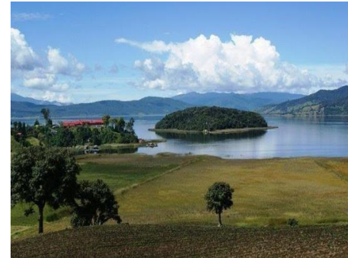
Laguna de la Cocha o Lago Guamuez, Nariño

!Educación, Investigación Eco-Geoturismo, Conservación, Prácticas Productivas Sostenibles!