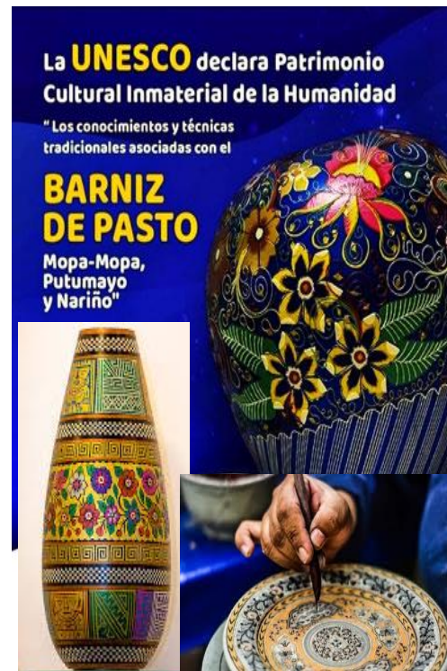
Artesanías de Nariño: a) Barniz de Pasto, b) Aplicación en Tamo y c) tejido en Paja Toquilla

Barniz de Pasto y Carnaval de Blancos y Negros