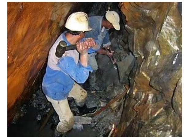
Molino y vivienda típica de minero artesanal y trabajo en galería