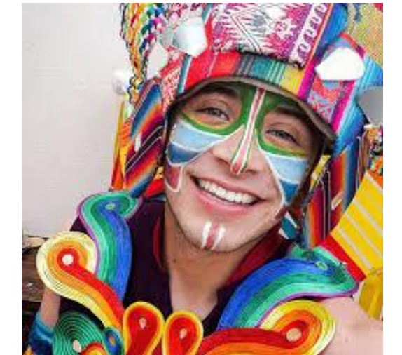
Carnavales de Negros y Blancos, Nariño