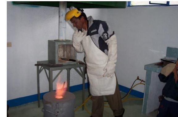
Procesos productivos ancestrales nariñenses