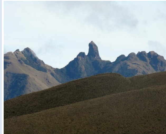
“Dedo de Dios”, sitio “El Chambú”, Cerro Gualcalá, Nariño