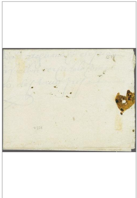
Imágen: Vista Posterior