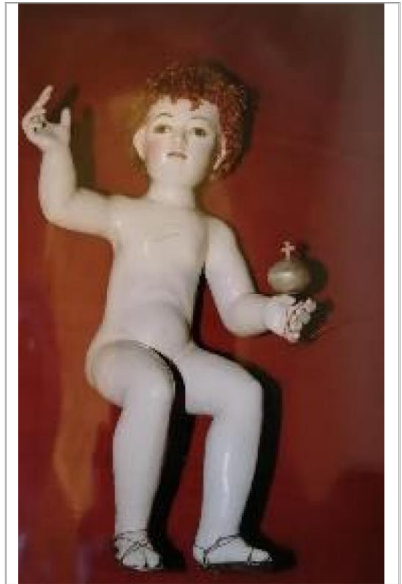
Imágen: Ref. "Niño Jesús"