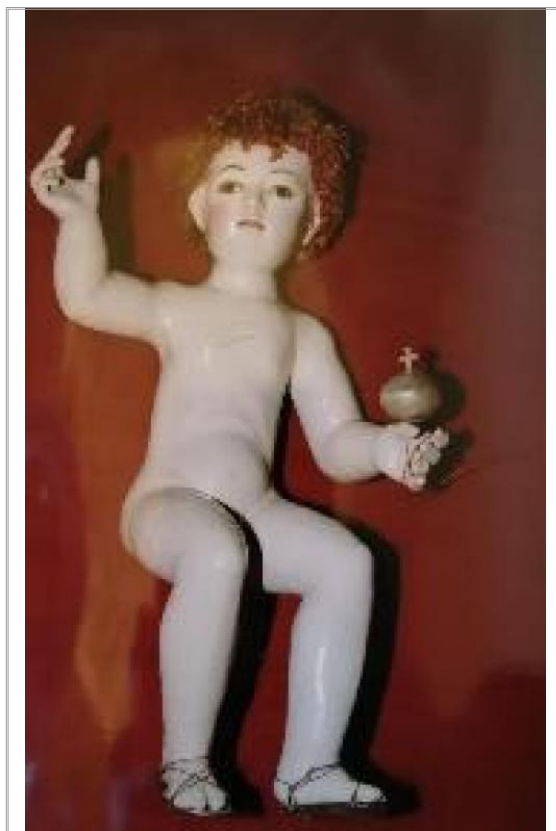
Imágen: Ref. "Niño Jesús"