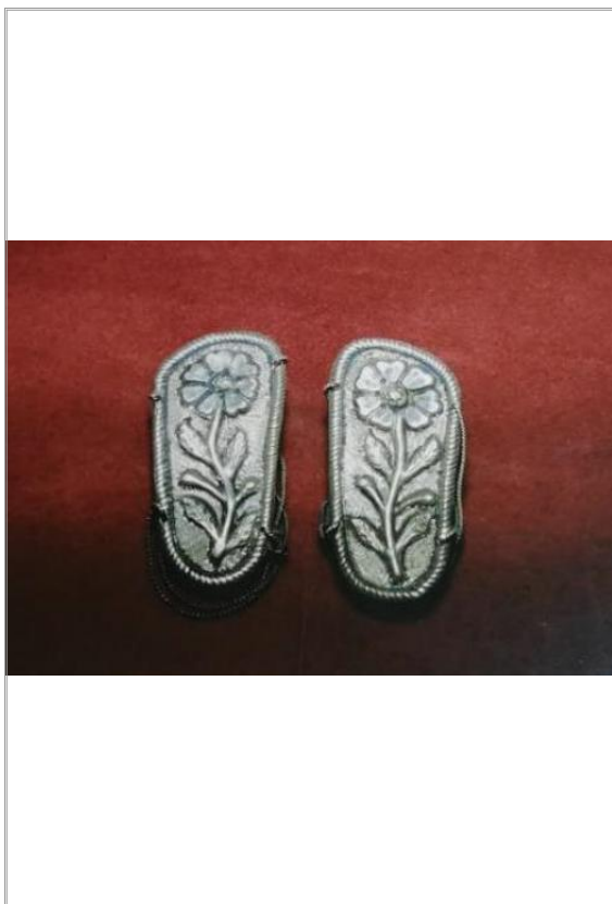
Imágen: Par de sandalias