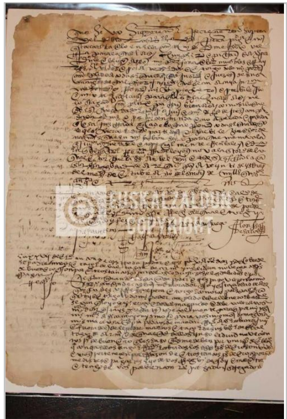
Imágen: Vista Posterior