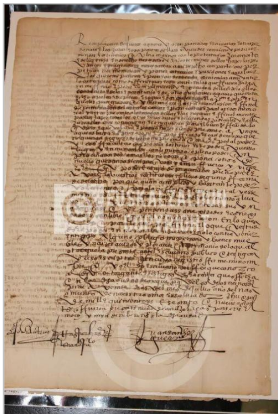
Imágen: Vista Posterior