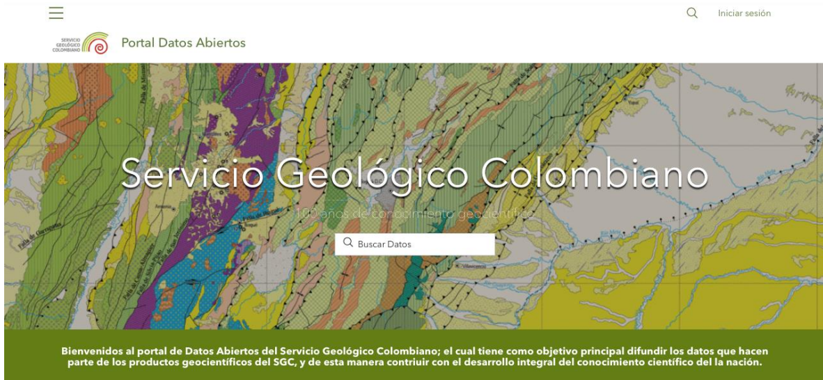
Ilustración 5. Portal de datos abiertos - SGC