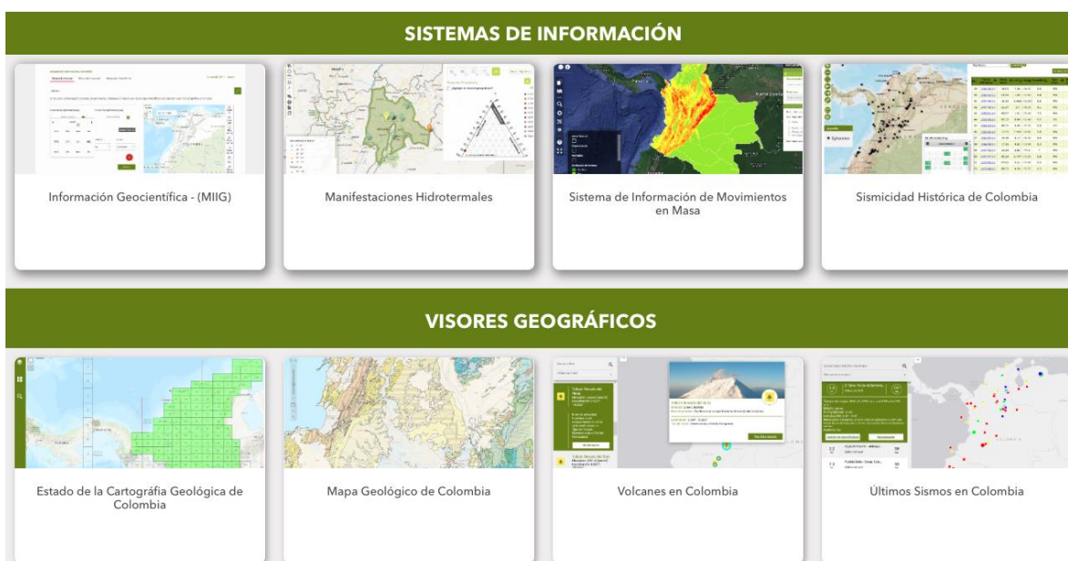
Ilustración 7. Sistemas de información y Visores Geográficos indexados - Portal de datos abiertos - SGC