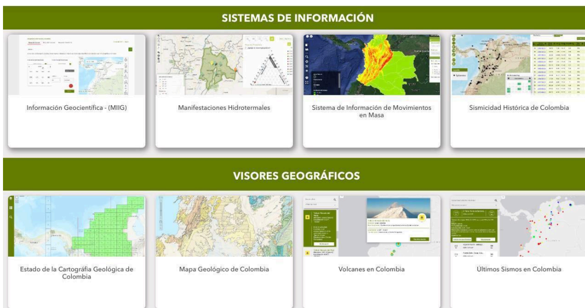
Ilustración 7. Sistemas de información y Visores Geográficos indexados - Portal de datos abiertos - SGC