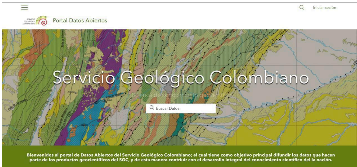
Ilustración 5. Portal de datos abiertos - SGC

El portal se encuentra distribuido en diferentes secciones que apoyen a los usuarios y/o grupos de interés a ubicar la información de una manera más sencilla. A continuación, se presentan algunas de las secciones con las que cuenta el sitio web https://datos.sgc.gov.co