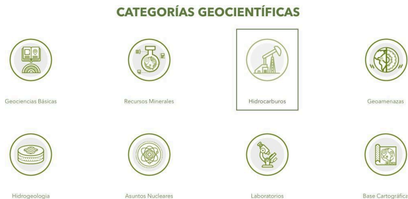
Ilustración 6. Categorías Portal de datos abiertos - SGC