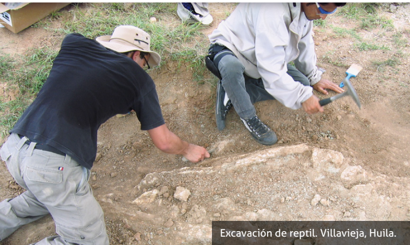
Excavación de reptil. Villavieja, Huila.