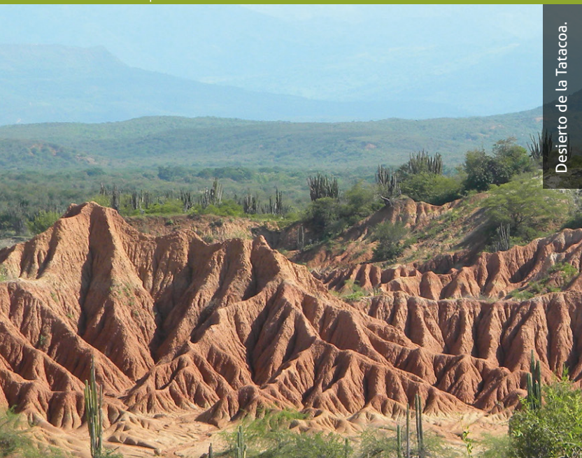
Desierto de la Tatacoa.

Cuando visites lugares de interés geológico, museos o lugares en donde se alberguen fósiles, recuerda estar al tanto de las recomendaciones del personal experto. Recuerda que son lugares únicos, con características especiales, que se han preservado por millones de años . Tus acciones son importantes para preservarlos.