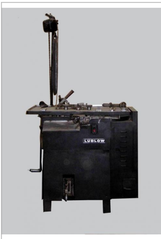
Imágen: Vista general