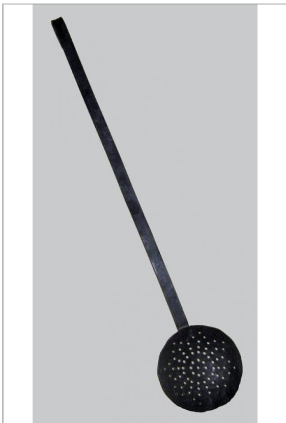
Imágen: Vista anterior