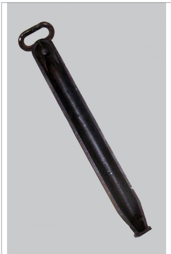
Imágen: Vista anterior